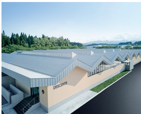
デサントアパレル水沢工場天窓に採用された「光拡散フィルム」

当社は今後も、光制御技術を活かした製品開発を通じて、持続可能な社会の実現に貢献してまいります。