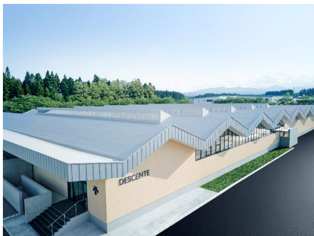
デサントアパレル水沢工場天窓に採用された「光拡散フィルム」

当社は今後も、光制御技術を活かした製品開発を通じて、持続可能な社会の実現に貢献してまいります。